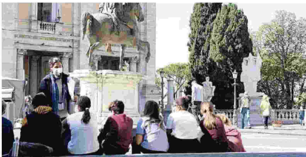
Lezioni alternative in piazza a Roma per una classe di studenti