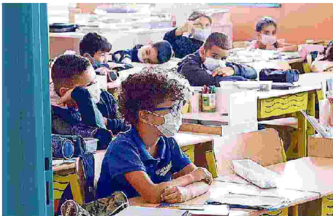
Scuola al via in nove regioni: il 94,3% del personale è vaccinato