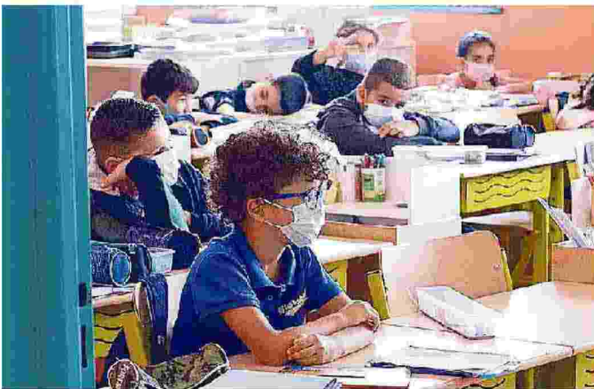
Scuola al via in nove regioni: il 94,3% del personale è vaccinato