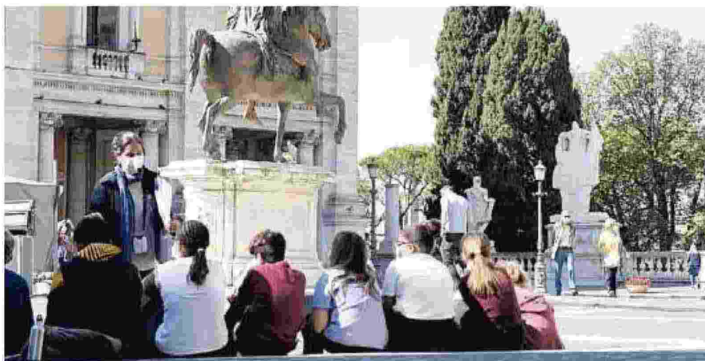
Lezioni alternative in piazza a Roma per una classe di studenti