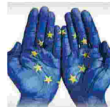
Tavola rotonda con i membri del Parlamento

Gli ultimi due appuntamenti del ciclo di incontri del progetto PULSER rappresentano il tentativo di portare tutte le questioni dibattute all'attenzione della comunità sociale, dei decisori politici nazionali e delle istituzioni comunitarie, spingendoli ad apportare le modifiche necessarie per adeguare la scuola italiana al pilastro europeo dei diritti sociali. Il 20 gennaio 2022, si terrà la presentazione dell'inchiesta pubblica promossa da Anief per tutto il personale e la cittadinanza. Il 28 gennaio (ore 17-19), in una Tavola rotonda, il presidente nazionale di Anief discuterà con i rappresentanti di tutte le forze politiche del Parlamento italiano per pensare le opportune risposte rispetto alle analisi e alle domande riscontrate.