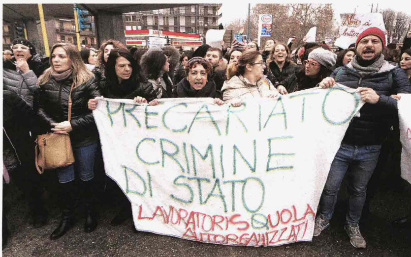
PROTESTA Le maestre diplomate dell'infanzia e delle elementari in corteo a Milano. Sotto, il ministro dell'Istruzione Valeria Fedeli, ex sindacalista, che sta cercando un compromesso

to da viale Trastevere, che in parte è stato chiuso, sede del Miur, al grido di slogan come «contro la sentenza noi facciamo resistenza» e «vogliamo le Gae» e con eloquenti cartelli («abilitate quando serve, licenziate quando conviene» e «no ai licenziamenti di massa»). Nelle scuole italiane diversi disagi per la protesta che secondo i sindacati che hanno promosso l'iniziativa - Anief , Saese e Cub con l'adesione dei Cobas - hanno coinvolto circa 20mila insegnanti precari mentre secondo il Miur si è trattato di un'adesione molto