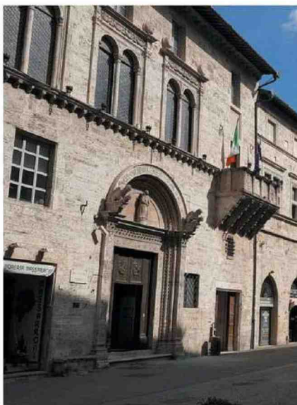
La Corte di Appello Ribaltata la sentenza resa in primo grado dal Tribunale di Perugia